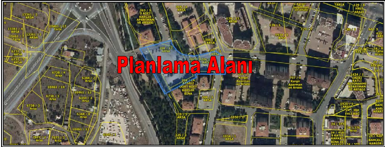
Resim 4: Planlama Alanının Mülkiyet Durumu