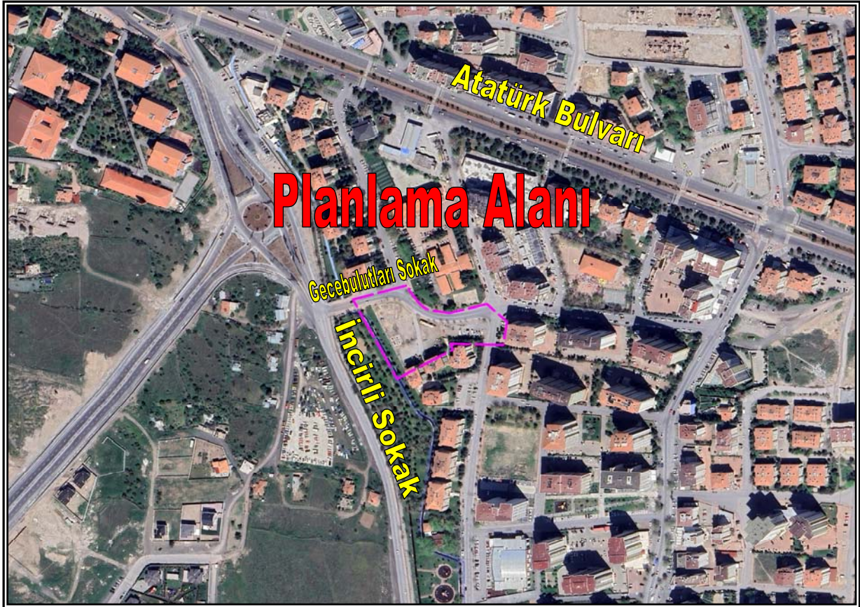
Resim 1: Planlama Alanının Konumu

Planlama alanı, düz bir arazi yapısına sahiptir. Bahse konu alan üzerinde herhangi bir yapılaşma görülmemiş olup doğal karakterli boş arazi statüsündedir. Planlama alanının yakın çevresinde ise konut kullanımlı yapılar, park ve doğal karakterli boş araziler yer almaktadır.