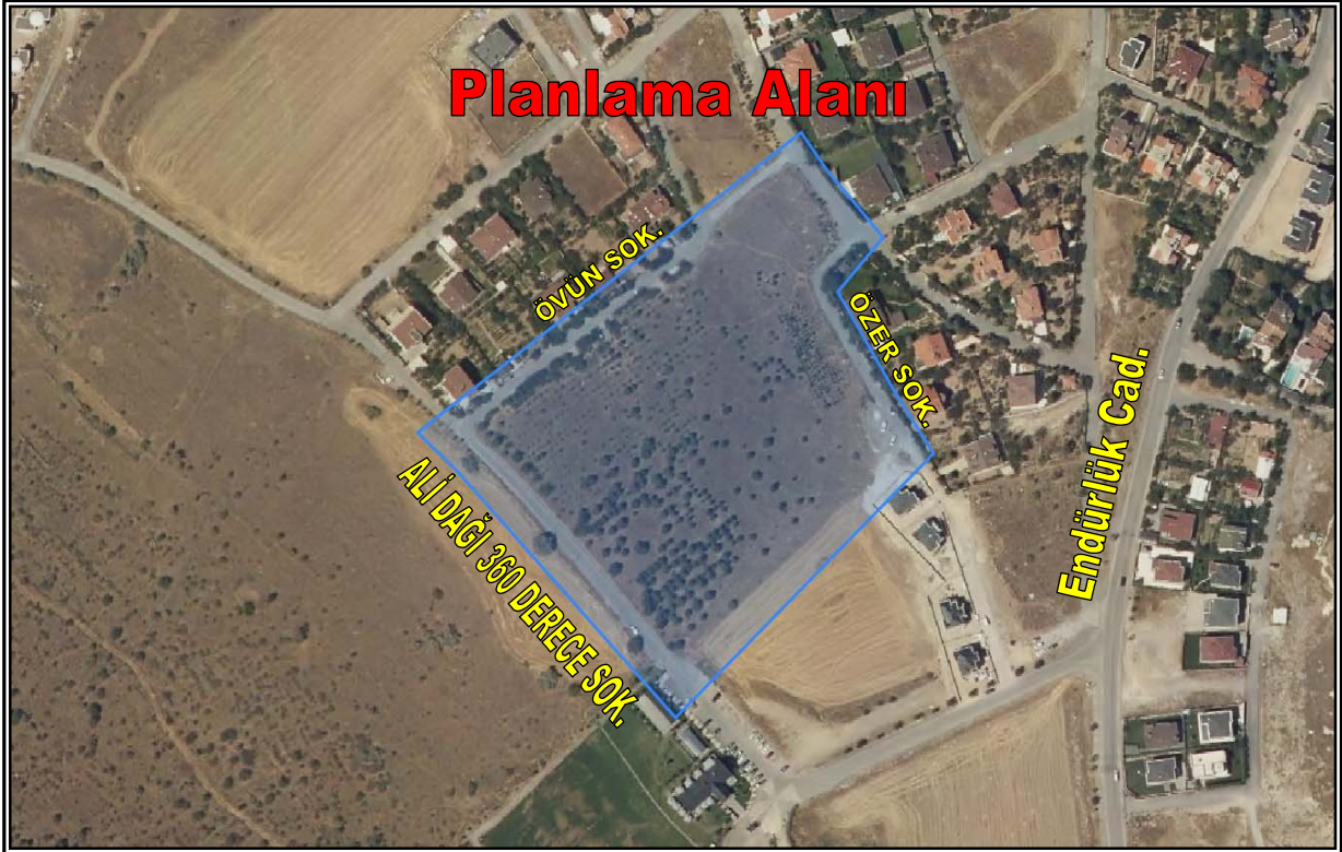
Resim 1: Planlama Alanının Konumu

Planlama alanı düz bir arazi yapısına sahiptir. Bahse konu alan üzerinde herhangi bir yapılaşma görülmemiş olup boş arazi statüsündedir. Planlama alanının yakın çevresinde ise 1-2 katlı, bahçeli, konut kullanımlı yapılar, belediyeye ait sosyal tesis ve boş araziler yer almaktadır.