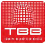
TÜRKİYE BELEDİYELER BİRLİĞİ